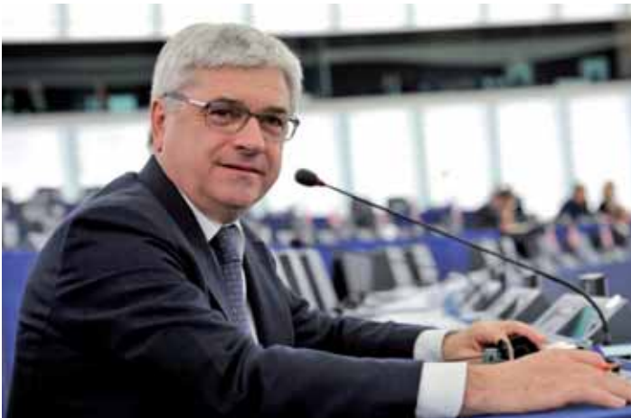
L'introduzione dei "titoli di progetto" non comporta, come per gli Eurobond, la modifica dei trattati. Gli Stati membri dovranno impegnarsi su snellimento burocratico e tempi di realizzazione

Il problema è che 1500 miliardi nelle casse di Bruxelles non ci sono. Da qui l'idea di Cancian di istituire un fondo unico per le infrastrutture e finanziarlo con l'emissione di titoli collegati ai progetti da realizzare. Attualmente il project bond prevede o che l'Europa dia garanzie (attraverso la Bei, banca Europea investimenti) o conceda un prestito subordinato per cui l'Unione finanzia fin dall'inizio l'infrastruttura. Nell'idea di Cancian, adottata da Barroso, la Ue interviene direttamente, sia nell'equity sia nel relativo finanziamento pro quota (30-50%) delle singole società di progetto di finanza, allo scopo di rendere sostenibile il business plan. L'Europa potrebbe re-