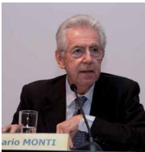
L'economista Mario Monti ha indicato la ricetta per uscire dalla crisi. Questa prende il nome di "riforme strutturali"

Dopo aver ottenuto la fiducia dal parlamento il governo è chiamato a predisporre il tanto atteso decreto sviluppo. Dalla Confindustria al Sindacato sino a tutti i rappresentanti dell'economia reale si è levato un coro di richieste e il pressing verso l'esecutivo si fa ogni giorno più intenso. Ma questa appare una partita tutta in salita poiché manca la chiarezza sulle misure da adottare per i veti incrociati all'interno della maggioranza e per l'ormai dichiarato stato di belligeranza dei ministri targati Pdl e il superministro dell'Economia Tremonti. Quest'ultimo vorrebbe infatti un decreto a "costo zero" per mettere in sicurezza i conti pubblici ma si sa che questo è difficilmente realizzabile.