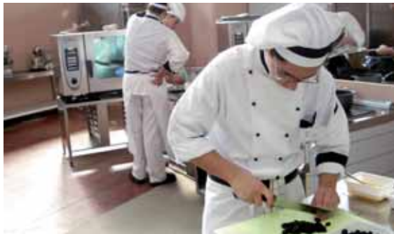
A trainare la domanda di impiego sarà il terziario che assorbirà il 70% dei nuovi rapporti, concentrandoli nel turistico e nella ristorazione

T ra ottobre e dicembre 2011 le imprese venete prevedono di effettuare poco più di 9 mila assunzioni, in calo rispetto alle oltre 13.500 pianificate nel trimestre precedente (un terzo in meno). La contrazione riflette il clima di incertezza che pervade il sistema economico regionale e il contesto di indebolimento della congiuntura nazionale e internazionale. Il quadro occupazionale emerge dall'analisi sui fabbisogni occupazionali delle imprese per il periodo ottobre-dicembre 2011, realizzata da Unioncamere del Veneto sulla base dei risultati dell'ultima indagine trimestrale svolta nell'ambito del Sistema Informativo Excelsior.