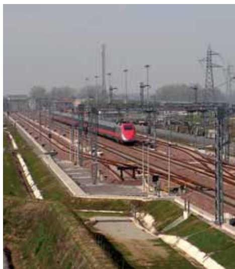
Buone previsioni anche sul fronte dell'Alta velocità ferroviaria c'è l'interesse di una cordata di industriali pronti ad investire

D ieci corridoi prioritari per realizzare entro il 2030 una rete centrale europea di trasporto, futuro asse portante del sistema di trasporto del mercato unico europeo. Su questi si concentreranno nei prossimi vent'anni le poche risorse comunitarie a disposizione, 31,7 miliardi di euro. Ma soprattutto si cercherà di mobilitare, anche attraverso lo strumento dei project bond strutturati dalla Bei, una quantità di risorse molto più ampia: fino a 500 miliardi entro il 2030, di cui la metà da spendere nei prossimi 10 anni. È il succo del piano di investimenti "Connecting Europe" per migliorare le reti viabilistiche presentato dalla Commissione europea e che prevede un importo complessivo di 50 miliardi. Alcuni dei progetti che la Commissione Ue ritiene più importanti per rendere più com-