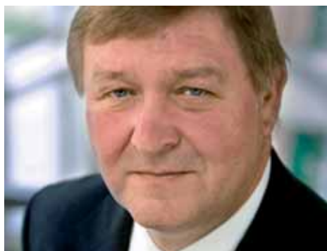
La presenza nel capitale delle imprese non può prolungarsi oltre i dieci anni, dopo verrà concordata un'exit strategy

La Newco avrà un capitale minimo di 10 milioni di euro ed una durata di quindici anni; opererà come un fondo di private equity acquisendo