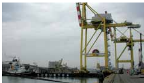
"Gli snodi fondamentali per il commercio estero sono i porti. Saremo strategici, quindi, grazie allo sbocco Nord adriatico"

I soldi non ci sono ma si possono immaginare proposte capaci di far partire operazioni finanziarie anche per le opere fredde.