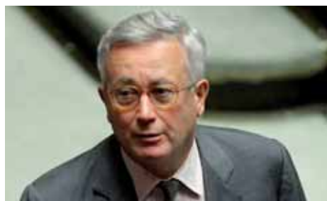
Non si sa quanto questa novità potrà essere efficace o se renderà più difficili i rapporti tra aziende e fisco

desima: innanzitutto le società semplici che non sono assoggettate alle disposizioni del reddito d'impresa come pure le società cooperative, di mutua assicurazione, gli enti commerciali e non commerciali residenti nel territorio nazionale, le consortili e le società ed enti non residenti privi di stabile organizzazione sulla base di quanto affermato dalla circolare ministeriale 25/E/2007. D'altro canto non rientrano nel dispositivo anche quei soggetti espressamente esclusi dalla manovra. Qui l'elenco è importante. Vale a dire le imprese che si trovano nel primo periodo di imposta, di quelle con più di 50 soci, delle quotate, di quelle controllate da soggetti quotati e dalle controllanti delle quotate e quelle partecipate da enti pubblici per almeno il 20%. Inoltre le società in regime consorsuale (amministrazione controllata o straordinaria, fallite o in concordato preventivo). Come pure le aziende di mino-