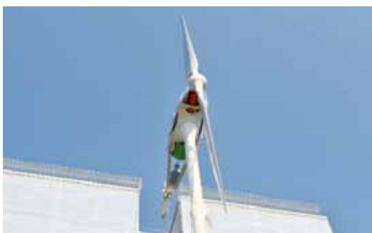
Particolare pala eolica di R. Piano

A marzo dell'anno successivo viene firmato un contratto di collaborazione tra EGP e lo studio Favero&Milan, riguardante la pro-